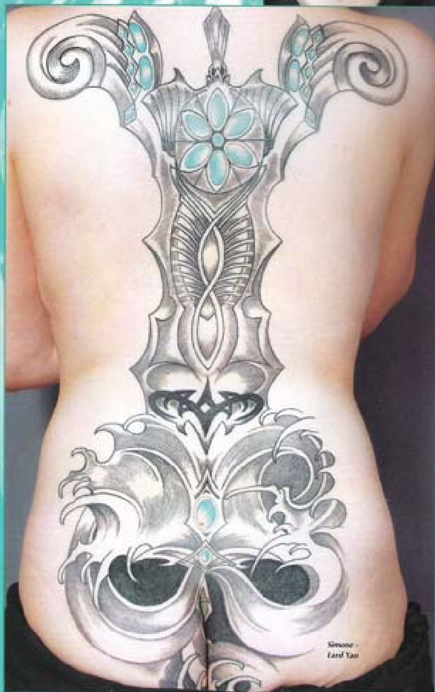
Shannon - Lard Yaw